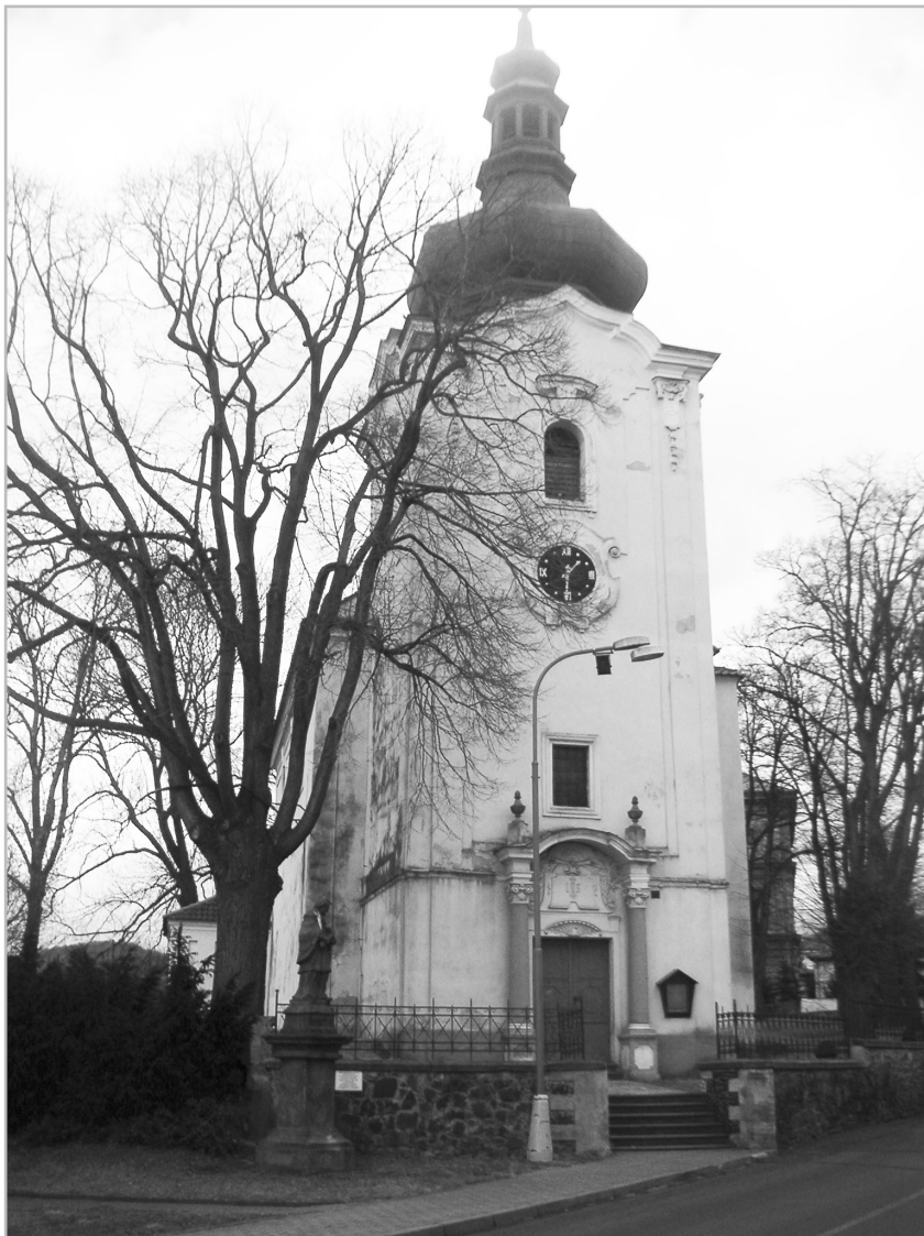
Kostel v Řehlovicích.