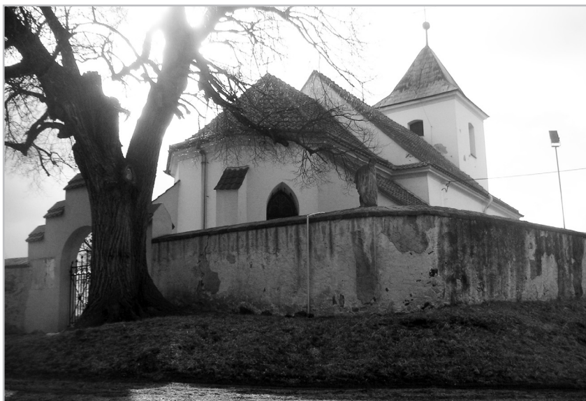
Starobylý kostel v Brozánkách. 2021