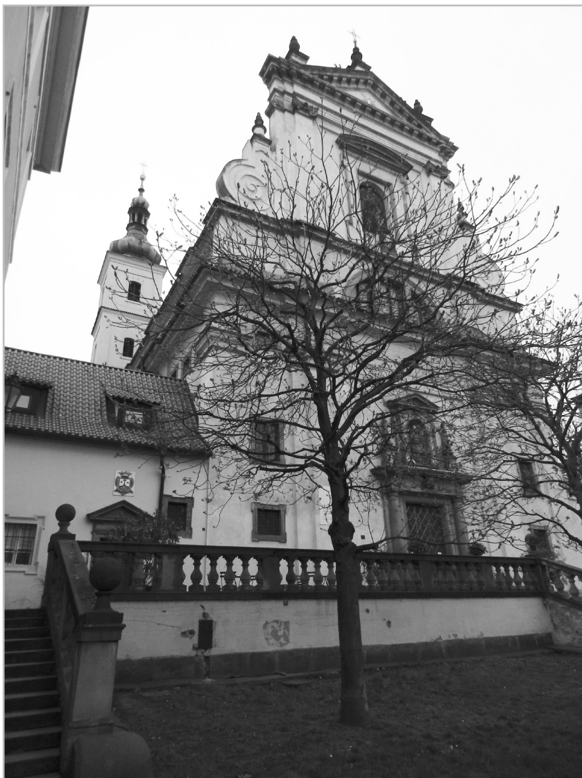
Kostel Panny Marie Vítězné na Malé Straně, kdysi luteránský kostel Nejsvětější Trojice. Foto J. Kilián 2021