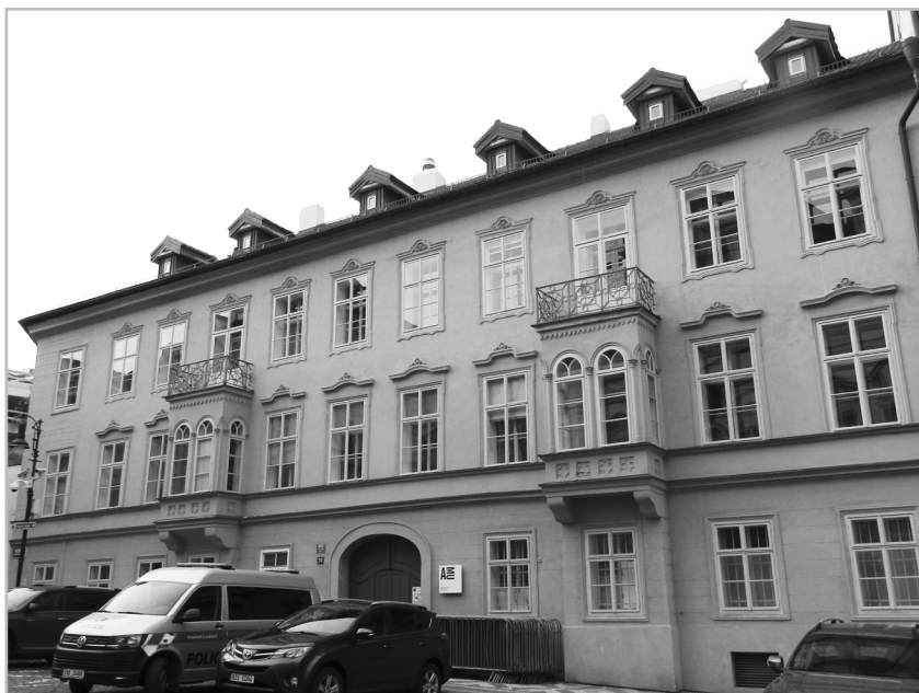
Tržiště 302, dříve malostranský dům Fridricha z Bílé. Foto J. Kilián 2021