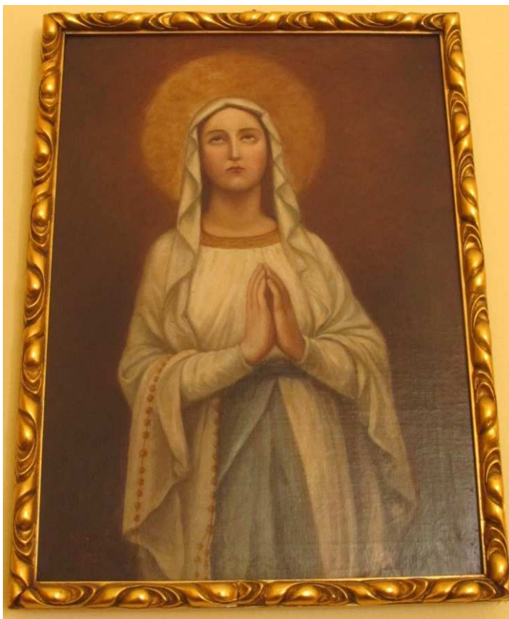
Příloha č. 6 – Obraz od Natálie Huynové. 108