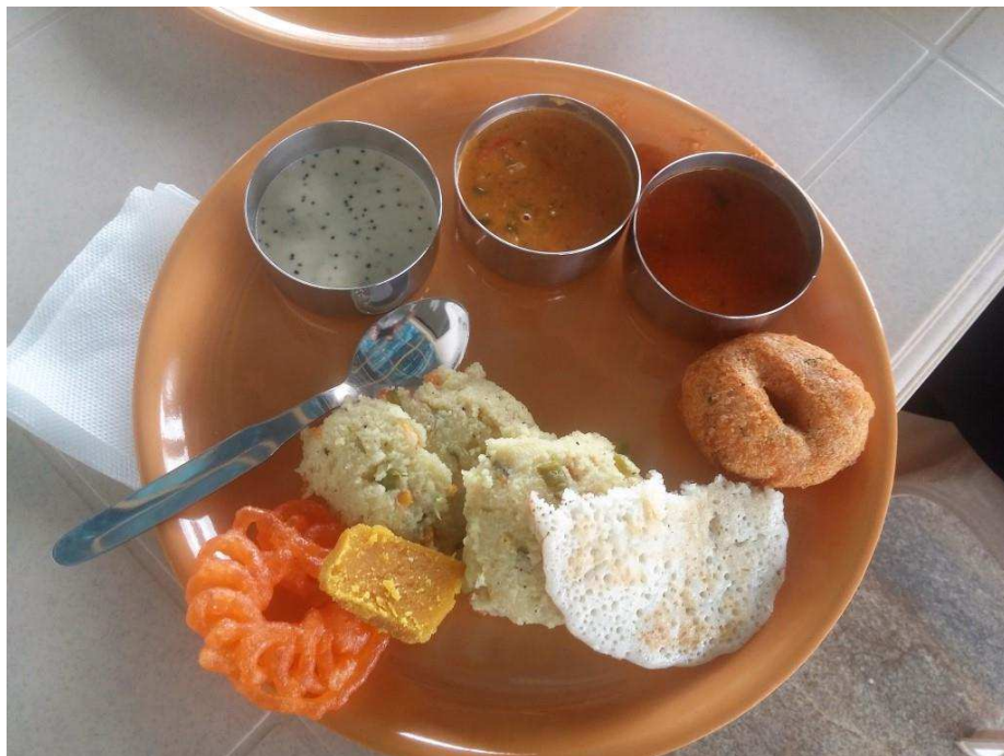
Obrázek č. 3: První „konferenční“ oběd v prostorách Srishti School.