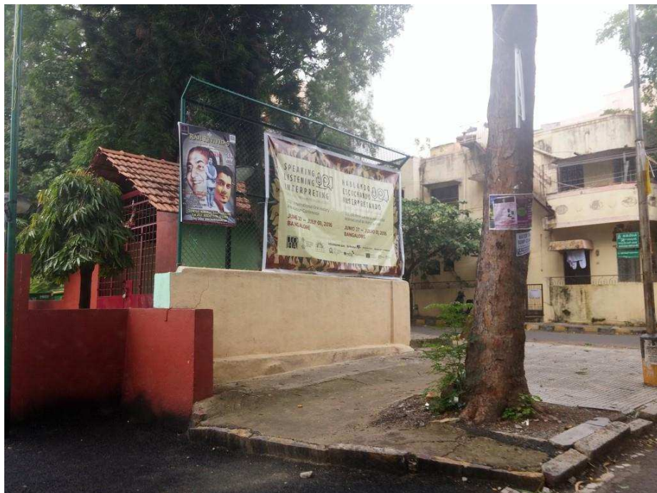
Obrázek č. 1: Plakát ke konferenci.