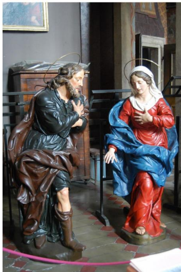
14. Sochy sv. Josefa a Panny Marie původně umístěné v Betlémské kapli (dnes pod kruchtou), kostel Nejsvětější Panny Marie a sv. Karla Velikého, Praha Karlov